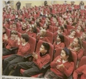
Alumnos del Corazón de María durante la presentación.