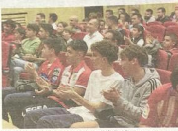
Algunos de los asistentes a la conferencia de Ramírez. DAMIÁN ARIENZA

«Soy canario, no del norte, necesito abrazar y tocar. Ahora los jugadores ya son todos un poco más canarios»