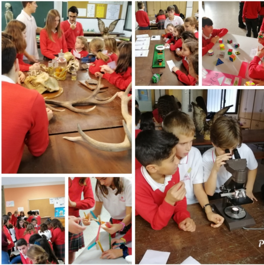
[2] El alumnado de 4º de ESO y de 1º de Bachillerato preparó una Feria de la Ciencia para sus compañeros de Educación Primaria, del mismo modo que los cursos de la ESO escucharon las noticias de divulgación científica generadas por sus compañeros de Cultura Científica de 1º de Bachillerato.

Coincidiendo con el desarrollo de las Jornadas de la Ciencia se presentaron los #RecreosNaukas orientados a la divulgación científica entre el alumnado de ESO y Bachillerato