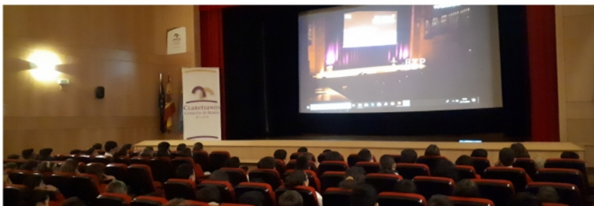
[3]. En la primera convocatoria el resultado superó todas las expectativas con cerca de ciento veinte alumnos asistentes.