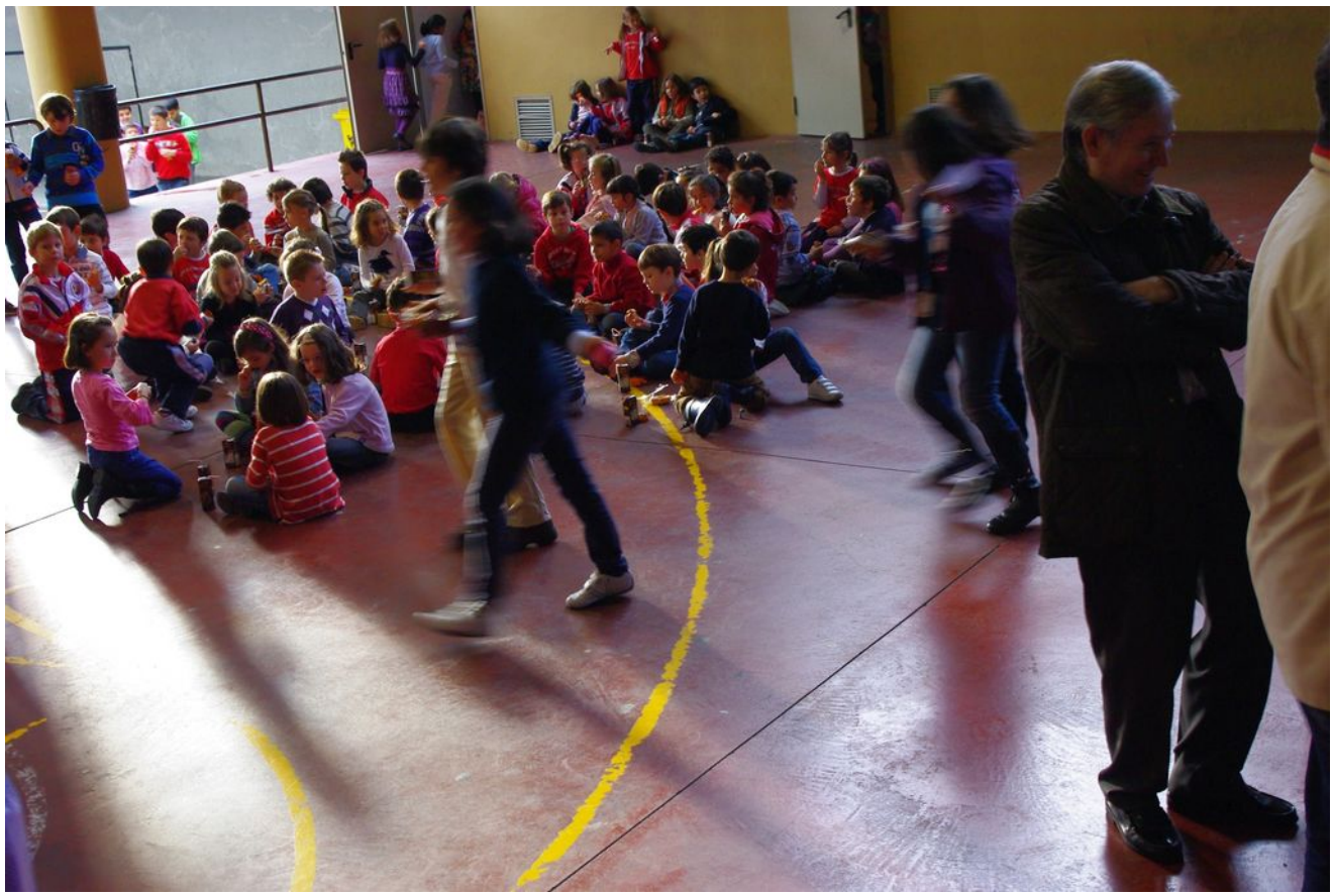
Tuvo lugar el tradicional chocolate solidario destinado al DOMUND,